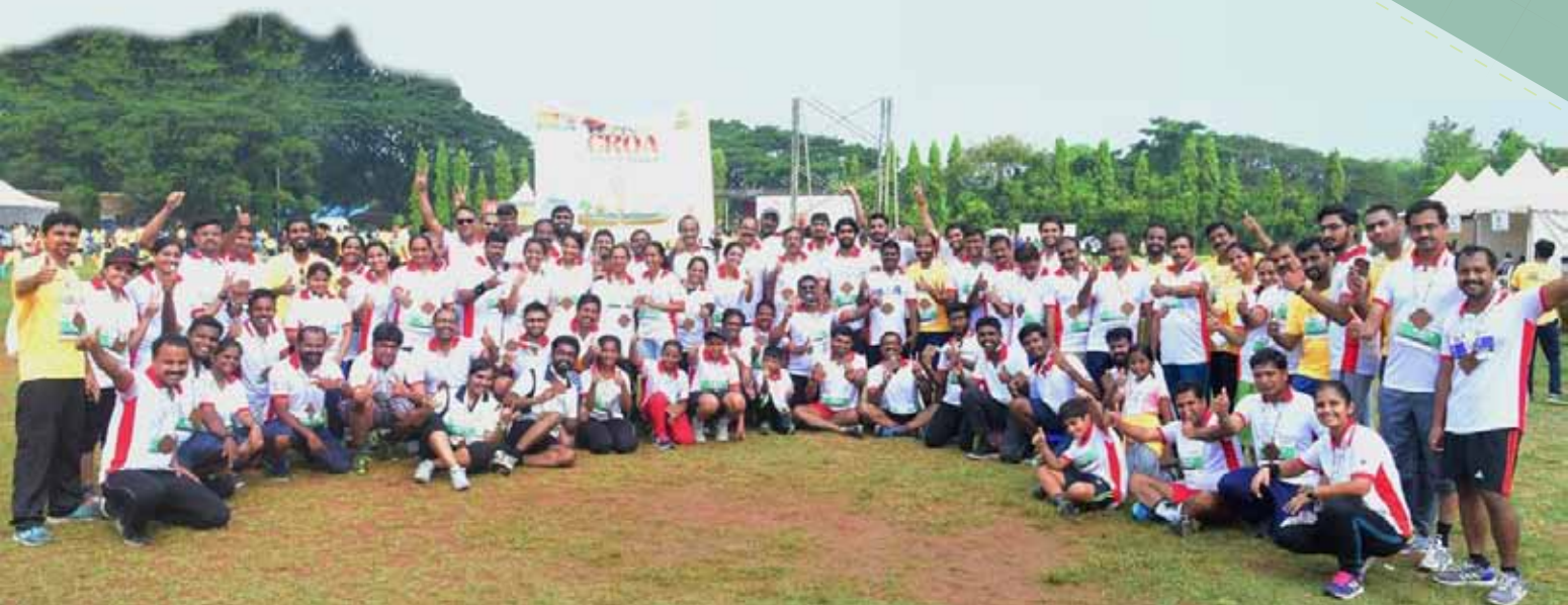
Kochi Refinery runners at the Spice Coast Marathon organized in Kochi on 11 November 2018.