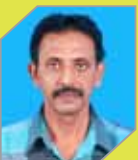
Gokulan E D P&U Utilities