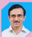
Sanjay S E&C