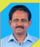
Sunil B P&U Utilities