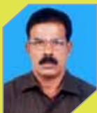
Antony K V P&U Electrical