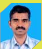
Joseph M G P&U Utilities